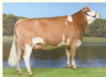
BLUME - Fiică de MOGLI