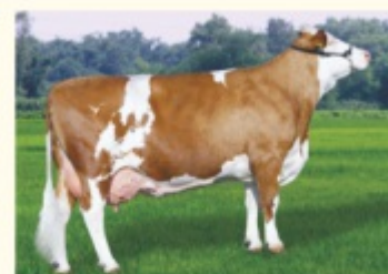
Bunica paternă JANA