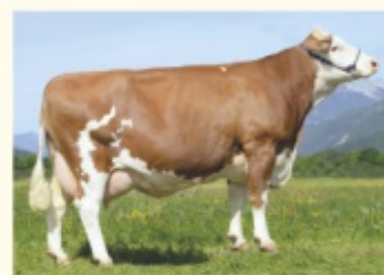
Bunica maternă LYDIA