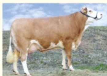
ROSI - Fiică de HERZSCHLAG