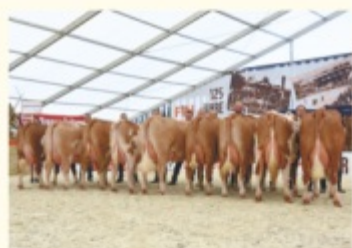
Grup fiice de HERZSCHLAG