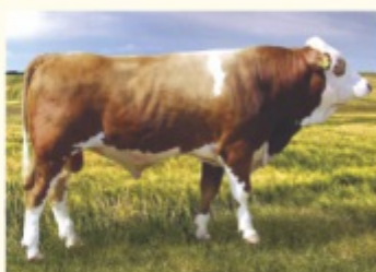
Bunicul matern WILDWEST