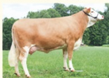
HELDIN - Fiică de HURLY