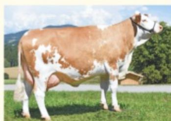
SILVIA - Fiică de HURLY