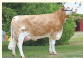
MIA - Fiică de HURLY