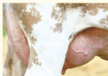
NORA (uger) - Fiică de HURLY