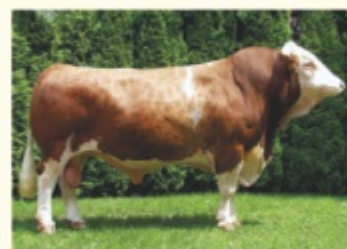
Bunicul patern HULOCK