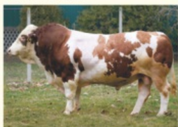
Bunicul matern WARBERG