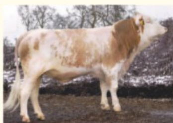
Bunicul patern MANDARIN