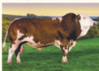
Străbunicul patern MANDELA