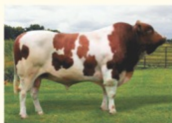
Străbunicul matern WARAN