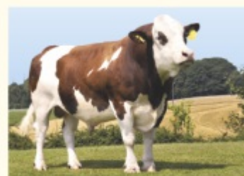
Străbunicul matern HUPSOL