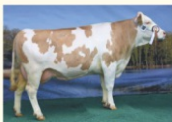
LINETH - Fiică de POLAROID