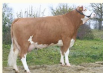
PAULINE - Fiică de POLAROID