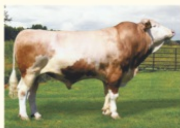
Bunicul patern POLARI