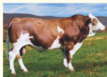
Bunicul matern MANITOBA