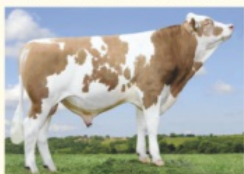
POSSMAN - Fiu de POLAROID