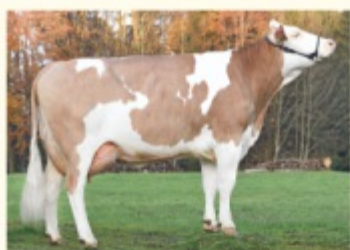
BALU - Fiică de VILLEROY