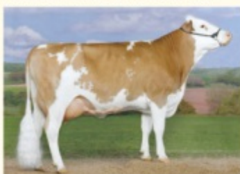
LAVILL - Fiică de VILLEROY