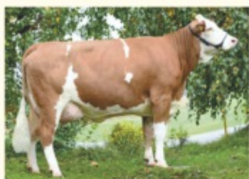
SMARAGD - Fiică de VILLEROY