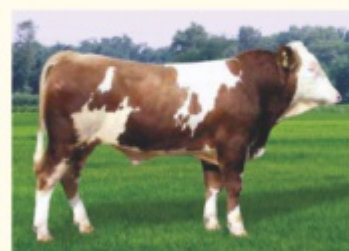
Străbunicul matern ZAHNER