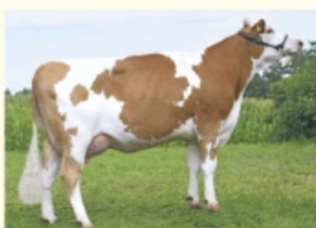
RANKE - Fiică de VILLEROY