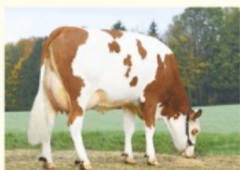
CHARLOTTE - Fiică de WITHOF P*S