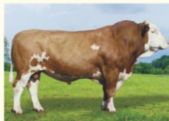
Bunicul patern WITZBOLD