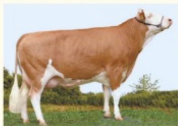
OLWEIN - Fiică de WITHOF P*S