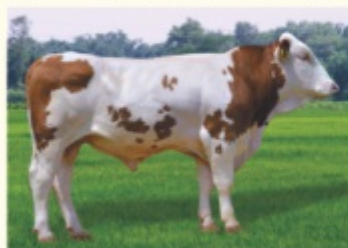
Tatăl WITAM P*S