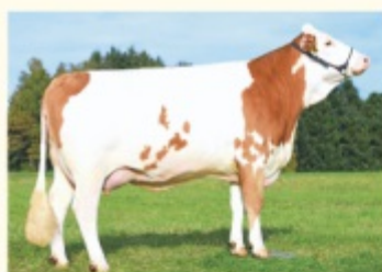
MARIE - Fiică de WITHOF P*S