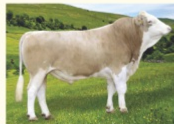
Bunicul matern INHOF