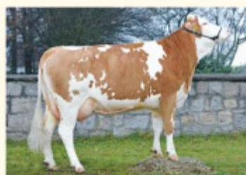
HAILY - Fiică de MOGUL