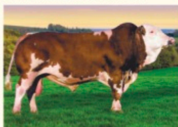
Bunicul patern MANDELA