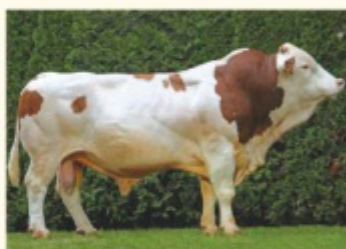
Bunicul matern VANSTEIN