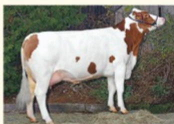
NELKE - Fiică de MOGUL