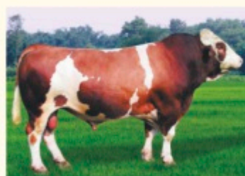
Străbunicul matern DIONIS