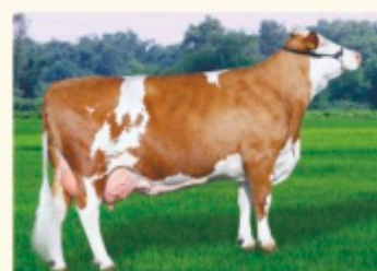
Bunica paternă JANA