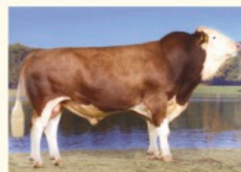
Bunicul matern MANIGO