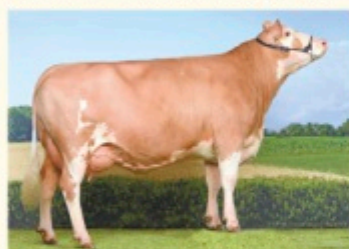
ECHO - Fiică de POLAROID