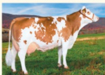
EVELIS - Fiică de POLAROID