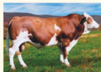
Bunicul matern MANITOBA