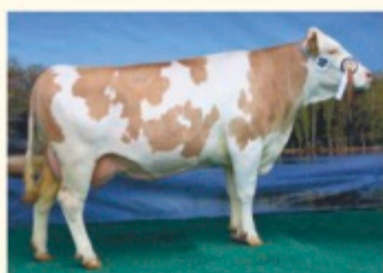
LINETH - Fiică de POLAROID