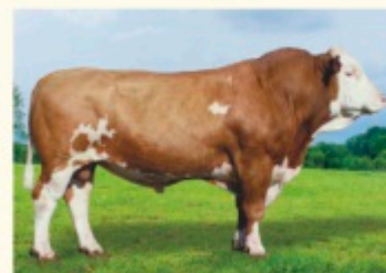
Bunicul matern WITZBOLD