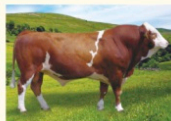
Bunicul matern ZAUBER