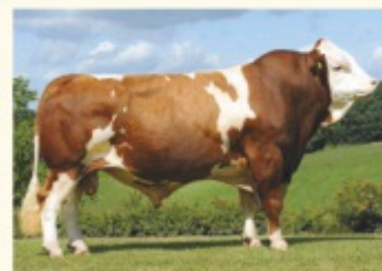
Bunicul matern WILLE