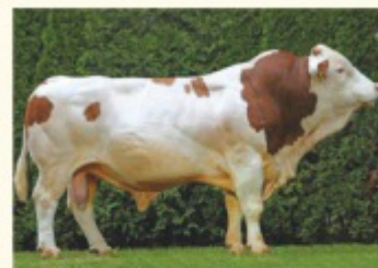
Bunicul matern VANSTEIN