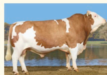
Bunicul matern ISERDA