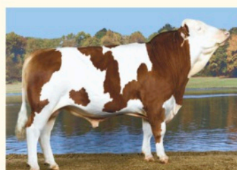
Tatăl WHOWHOP P*S