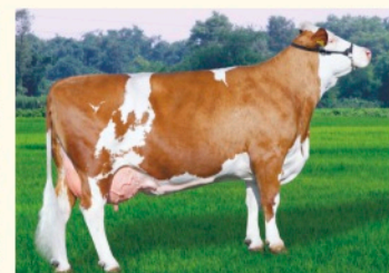
Bunica paternă JANA