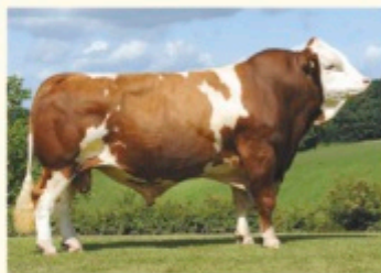
Străbunicul patern WILLE