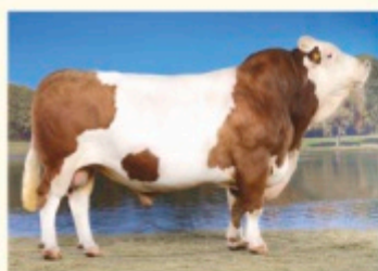
Bunicul patern HUTERA