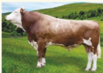
Bunicul matern INFORMANT