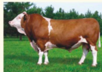
Străbunicul mat. WALDBRAND