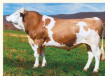
Bunicul matern MUNGO Pp