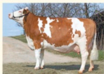
FEE - Fiică de IRREGUT P*S