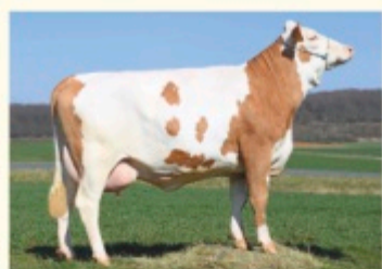
667 - Fiică de IRREGUT P*S

Lapte, Carne, Uger, Musculatură, 50% viței fără coarne