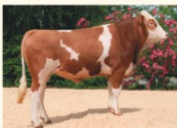
Bunicul patern IROLA PS