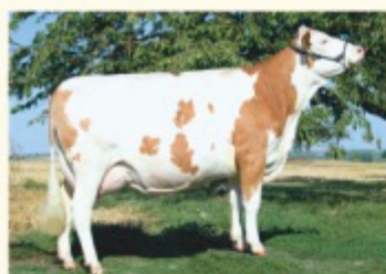
NORI - Fiică de IRREGUT P*S