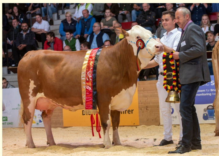
Fiică - Miss Germania 2023

Lapte și compoziție lapte, Conformație uger, Funcționalitate