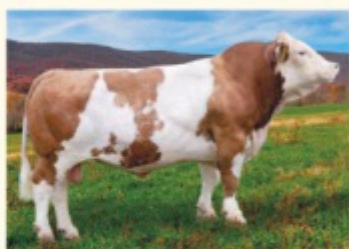
Străbunicul matern HUTMANN