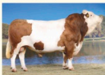
Bunicul matern HUTERA