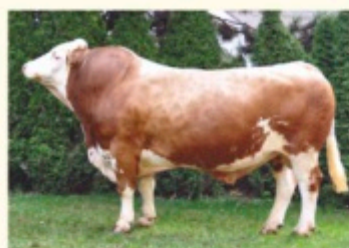
Bunicul patern HULDIG