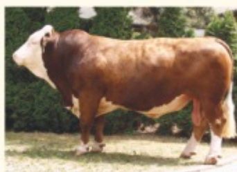
Străbunicul matern IMPOSIUM