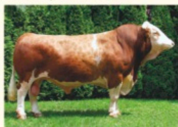
Străbunicul patern HULOCK