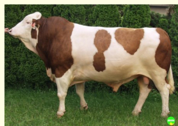
RALMESBACH P*S - Străbunul patern