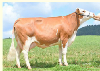
TAUBE Pp - Mama