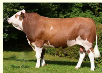
MAHANGO Pp - Bunicul matern