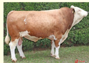
MERTIN - Străbunul matern