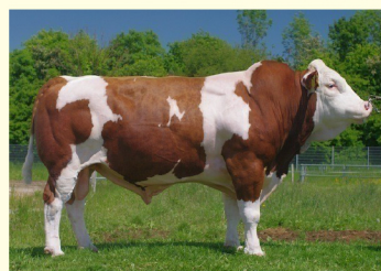
REUMUT - Bunicul patern