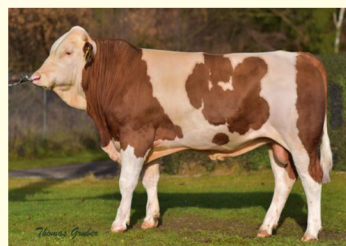
VESPASIAN P*S - Tatăl