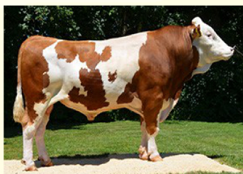
Tatăl - HASHTAG