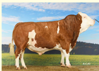
Străbunicul patern - HERZSCHLAG