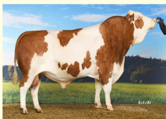
Bunicul patern - HAYABUSA