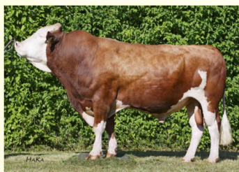
Bunicul matern - DELL