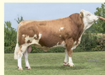
Străbunicul matern - MANDRIN