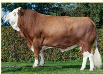
Tatăl - MANOLO Pp