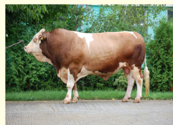
Străbunicul patern WAPULS