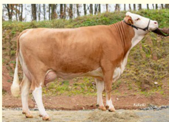
ROLEX - Fiică de MONOPOLY