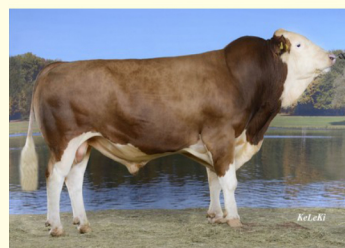
Bunicul patern MANIGO