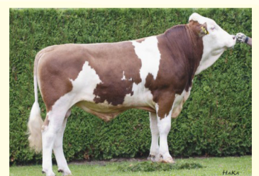
Bunicul matern - REMMEL

Funcționalitate, Conformație, Lapte, Sănătate uger, Picioare, Musculatură, Talie mare, 50% Viței fără coarne