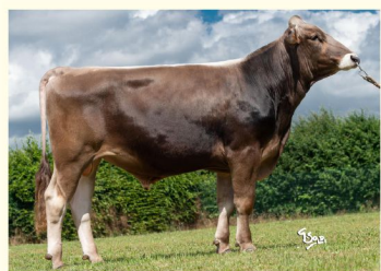
OPTIMAL - Tatăl