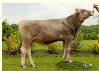
LOUSTIC - Bunicul matern