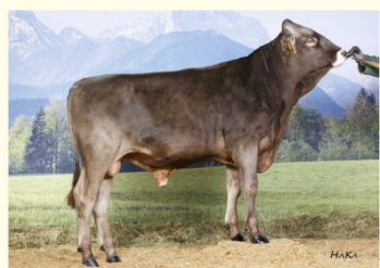
GS SINATRA - Bunicul patern