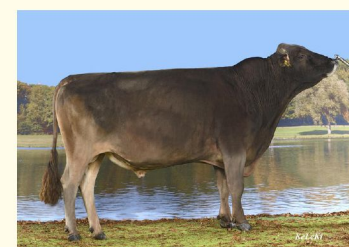
ANIBAL ET - Străbunicul matern