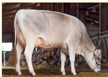
OHEA ABF - Mama