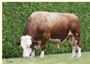
Străbunicul patern - RALDI