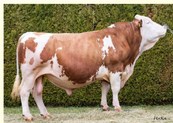
Tatăl - WUESTENSOHN