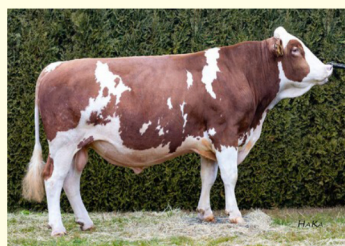
Bunicul patern - WORLD CUP