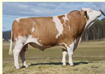
Străbunicul patern - WERTVOLL