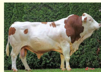
Străbunicul matern - VANSTEIN